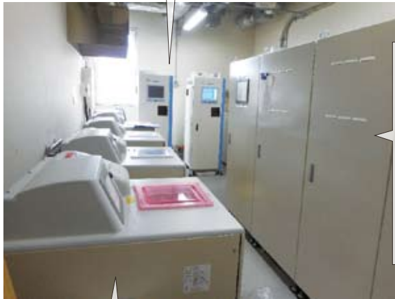
逆浸透精製水製造システム (RO装置)